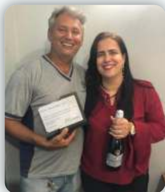
Escola Balão Azul Desde: 29 de setembro de 2011