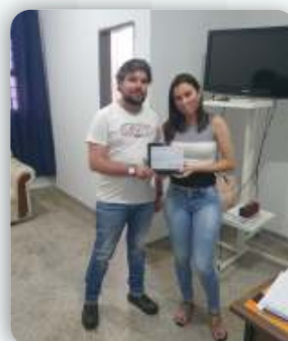
Esc. Evang. Princípio da Sabedoria Desde: 13 de agosto de 2011