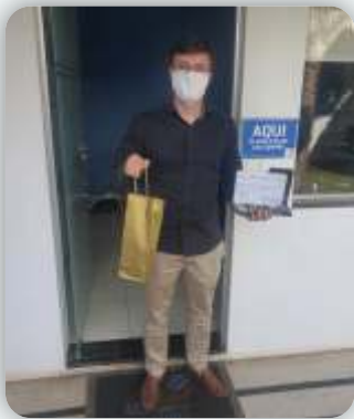
Escola Infantil Monteiro Lobato Desde: 30 de setembro de 2011