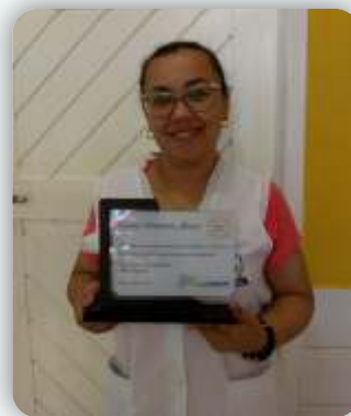
Escola Sabedoria Júnior Desde: 02 de novembro de 2010