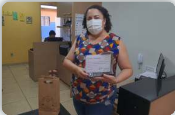
Escola Expoente Educacional Desde: 21 de outubro de 2011