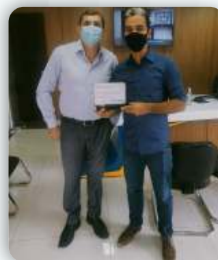
Colégio Expressão Desde: 30 de setembro de 2011