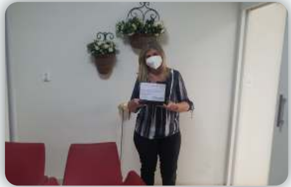
Centro Educacional Casinha Feliz Desde: 17 de outubro de 2011