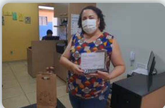
Escola Interação Desde: 04 de agosto de 2011