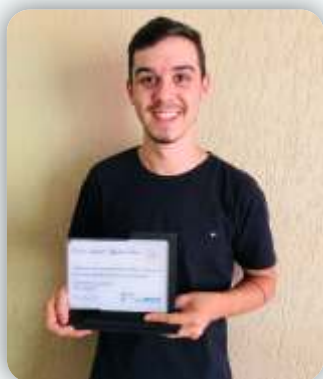
Escola Infantil Algodão Doce Desde: 14 de setembro de 2010

E as homenagens continuaram. Foi entregue uma singela homenagem para cada um de nossos clientes que fizeram 10 anos de parceria conosco. O próprio Diretor Comercial Cláudio Teixeira as entregou, já outras foram enviadas através dos Correios.