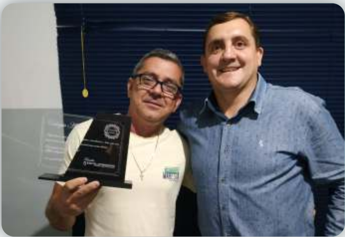
Colégio Atlanta Desde: 17 de agosto de 2009