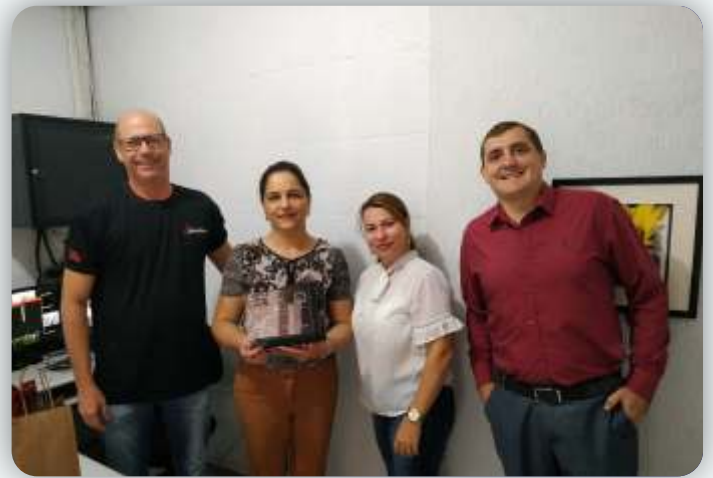
Colégio Executivo Desde: 15 de dezembro de 2009