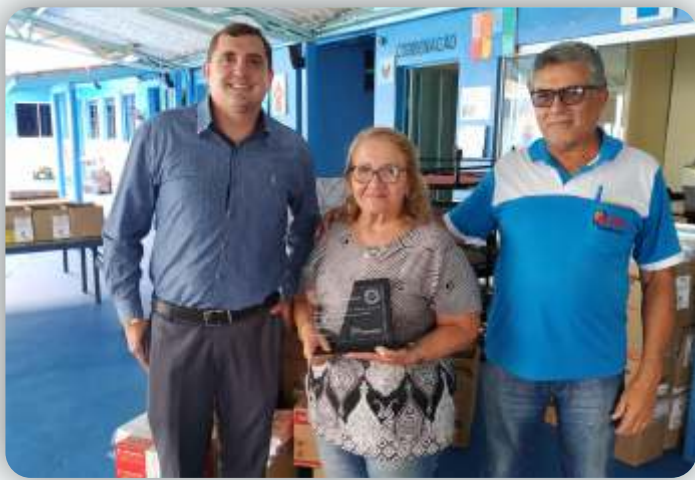
Escola Rosamarques Desde: 26 de maio de 2009