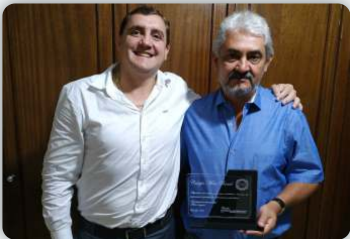
Colégio Meta Brasil Desde: 19 de novembro de 2009