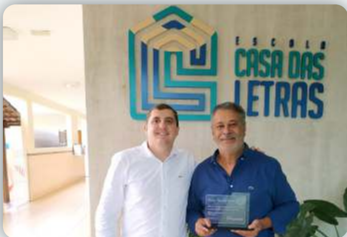
Escola Casa das Letras Desde: 22 de setembro de 2009