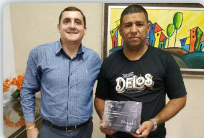
Colégio Delos Desde: 14 de abril de 2009