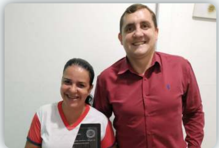
Trilhando o Futuro Desde: 30 de outubro de 2009