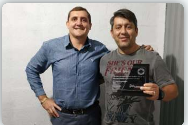
Colégio Unus Desde: 30 de janeiro de 2010