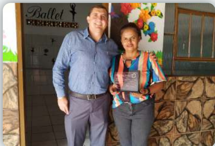
Colégio Luz da Vida Desde: 14 de abril de 2009