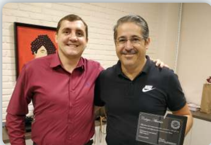
Colégio Absoluto Desde: 27 de janeiro de 2010