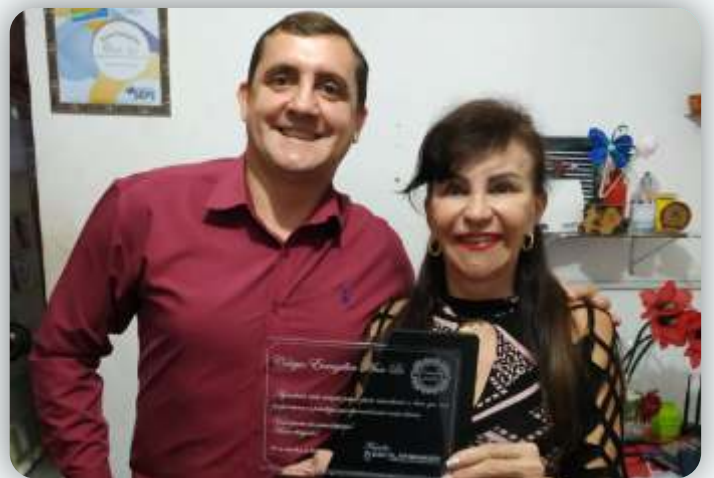
Escola Evangélica Ana Lú Desde: 09 de setembro de 2009