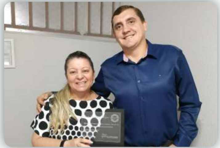
Escola Castelinho Mágico Desde: 15 de junho de 2009