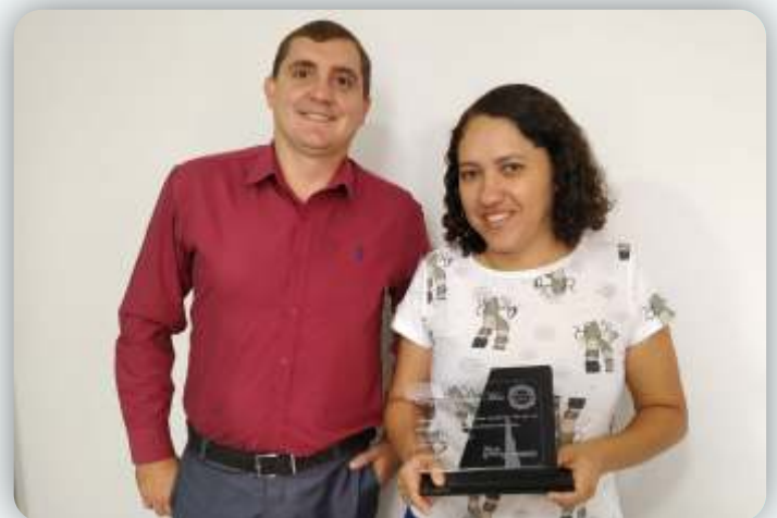
Aprender Mais Desde: 11 de outubro de 2009